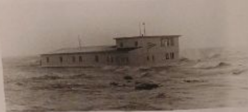
Bootshaus bei Sturmflut, 1962 – Die Sturmflut am 16. Februar 1962 stellte den Pfahlbau auf eine harte Probe. Das Gebäude war den anrollenden Wellen schutzlos ausgesetzt, doch die Schäden blieben überschaubar.