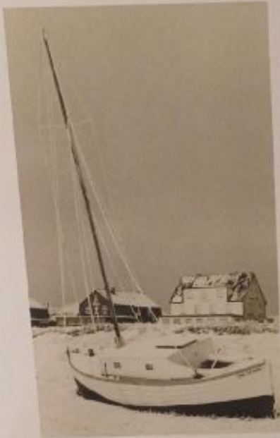
Bootslagerung auf dem Heller, 1930er Jahre – Bis Ende der 1950er Jahre mussten die häufiggefahrenen Holzboote ganzjährig draußen gelagert werden. Darunter litt das Material enorm.

Bereits Anfang der 1950er Jahre wuchs der Wunsch nach einem eigenen Bootshaus. Nach ersten Plänen an der Billstraße entschied man sich 1956 für ein Grundstück im Ostdorf – eine nasse Wiese am Heller, erworben für 30 Pfennig pro Quadratmeter.