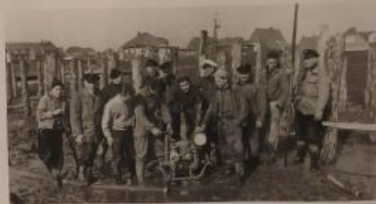
Einsägen der Pfähle, 1958 – Die Arbeiten im Watt waren anstrengend, kalt und dreckig. Wasser wurde mit Pumpendruck über eine Lanze ins Erdreich gepöbelt, in den weichen Schlack konnten dann die Pfähle einsacken. Hier sieht man die Vertriebskameraden um die Spülpumpe postiert.

Schon im Herbst 1959 fanden die ersten Boote im Winterlager Platz. Nach Fertigstellung des Turmes mit Unterrichts- und Klubraum wurde das „Jugendseglerheim“ 1960 dann feierlich eingeweiht.