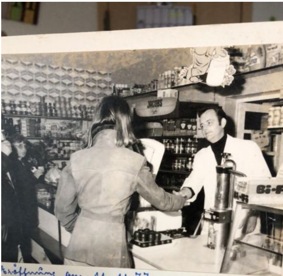
Eröffnung am 11. 11. 77