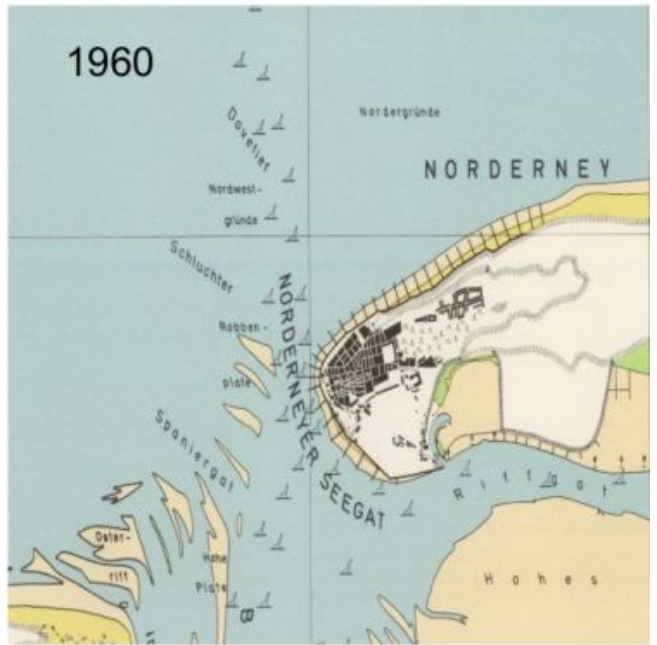
Historisches Kartenwerk: Das Beispiel Norderney