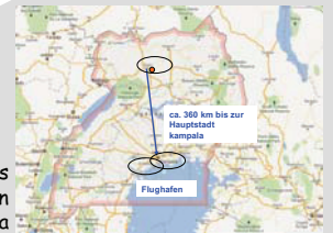
Lage des Grundstückes in Uganda