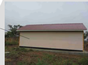
Fertiggestelltes Lagerhaus für Baumaterial und Geräte