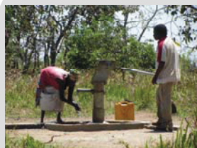
Brunnen der Stiftung auf dem Schulgrundstück, zugänglich auch für die Nachbarn.

Konto für Spenden Bank für Sozialwirtschaft BLZ 700 205 00 Kto.-Nr. 375 1220 122