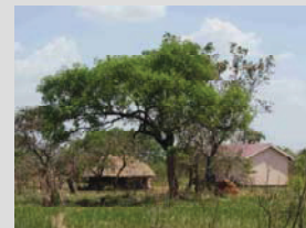
Blick auf das Schulgrundstück mit Lagerhaus und Toilettenanlage