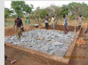
Fundament des Lagerhauses