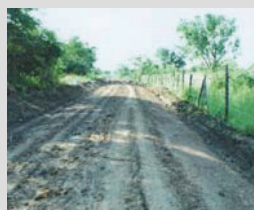
Ausbau des Fahrweges zum Grundstück