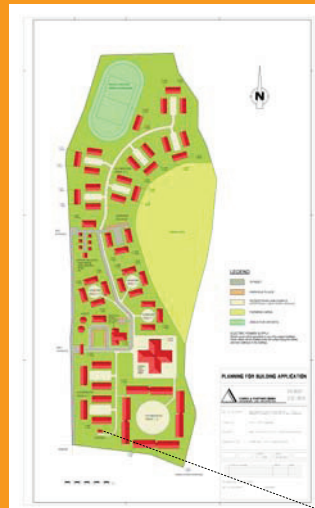
Lageplan Schulgrundstück (Entwurf)