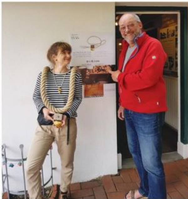
AUF DIE EINLADUNG VON DIE INSELGOLDSCHMIEDE

GESTALTEN SIE IHR EINZIGARTIGES BERNSTEIN UND HOLZ SCHMUCKSTÜCK UND ASSISTIEREN SIE BEI DER ANFERTIGUNG. EIGENER BERNSTEIN KANN GERN MIT GEBRACHT WERDEN.